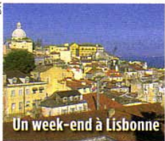
Un week-end à Lisbonne

Go Voyages propose des packages vol+hôtel pour les ponts de mai. A Lisbonne, 4 jours/3 nuits, à partir de 300 € TTC par