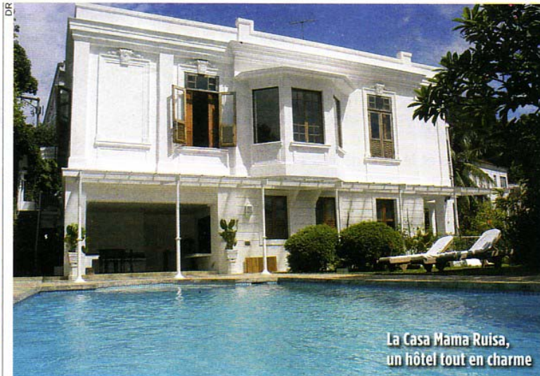
La Casa Mama Ruisa, un hôtel tout en charme

personne, vol A/R, taxes de séjour, petits-déjeuners en hôtel 2 étoiles proche de la place de Espanha. 0.899.651.851, www.govoyages.com ■ C.M.